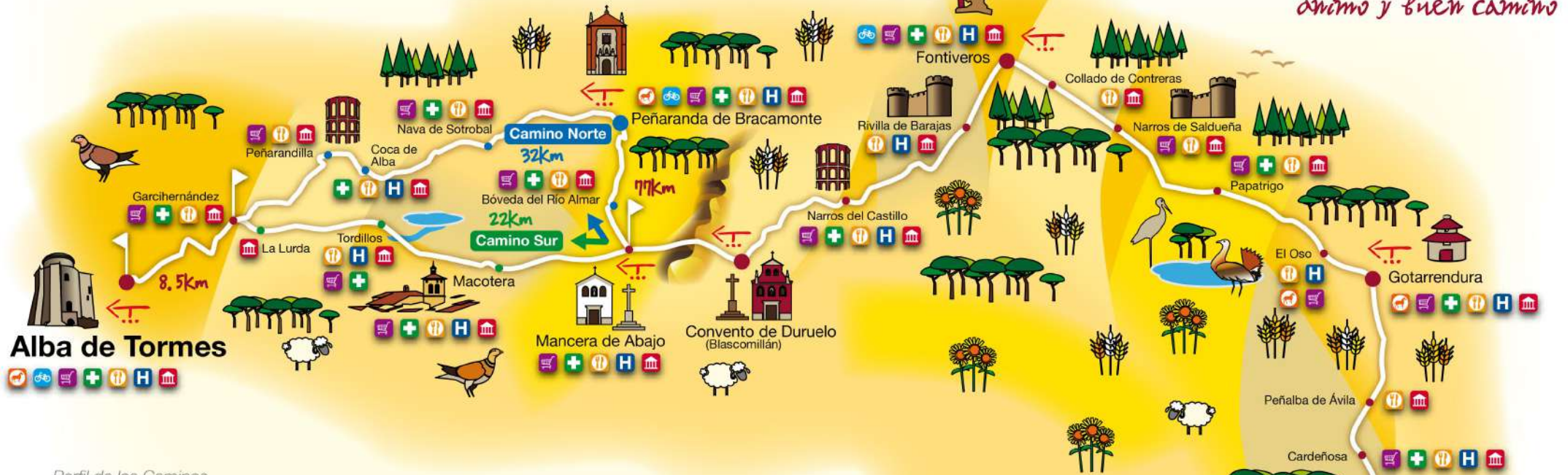
Perfil de los Caminos

Ya es tiempo de caminar ánimo y buen camino